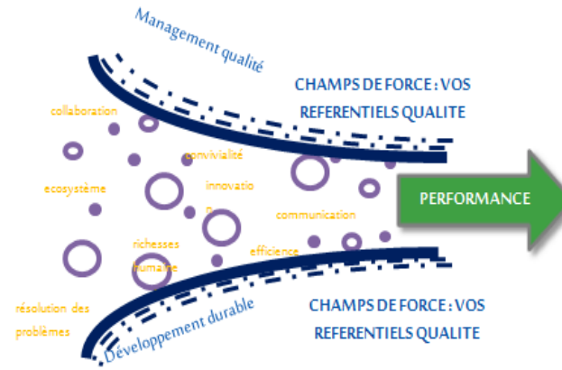
Schéma inspiré des travaux de Jean-Pierre Caliste, 2015